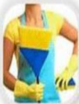
Влажная уборка помещения